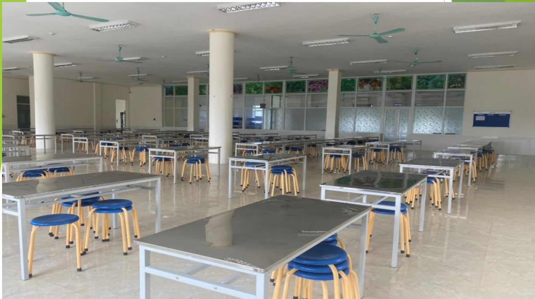
01 nhà ăn 2 tầng