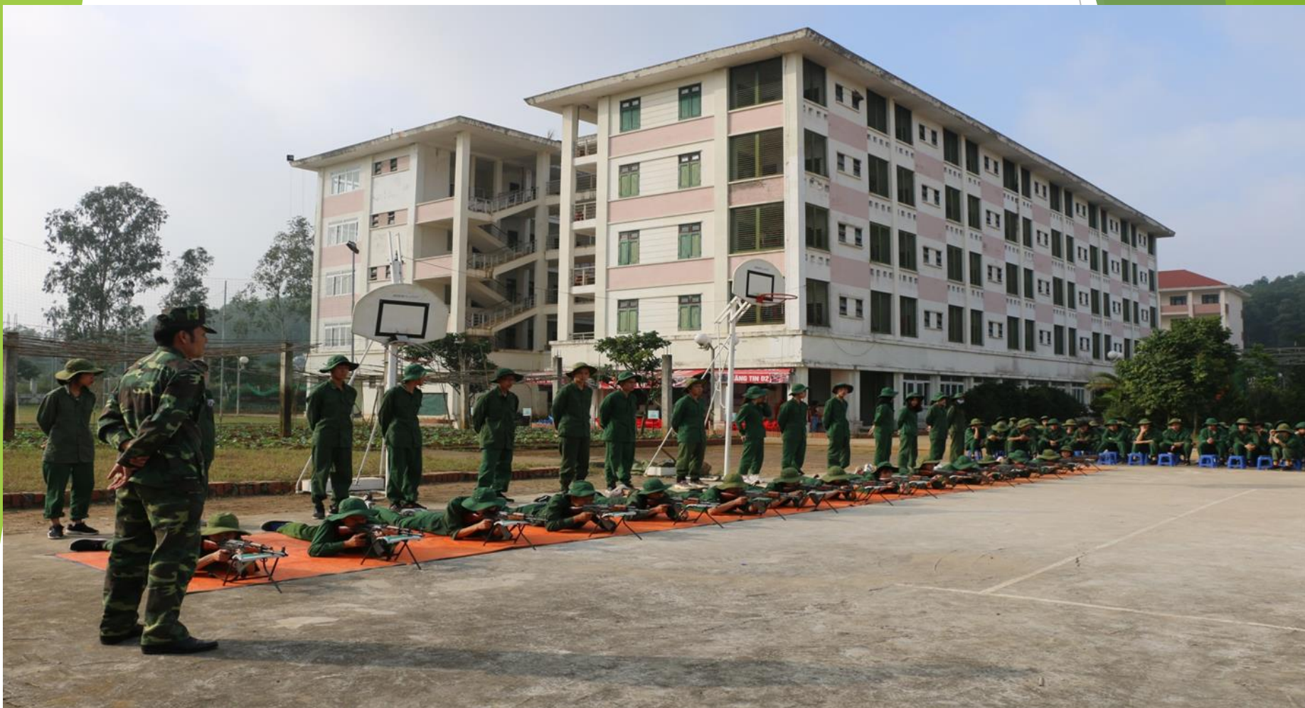
Hệ thống các bãi tập