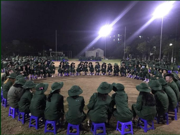
HOLA trong tối